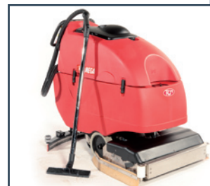
LANCIA LAVAGGIO-ASCIUGATURA LANZA FREGADORA-SECADORA LANCE DE LAVAGE-SECHAGE