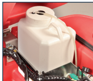
DOSATORE DETERGENTE ON BOARD DOSIFICACIÓN DETERGENTE A BORDO DOSEUR DE DETERGENT INCORPORE