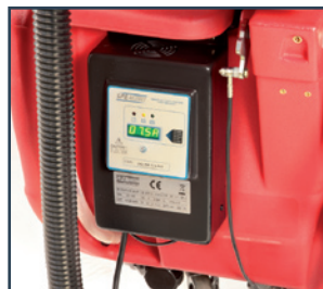
CARICA BATTERIE ON BOARD CARGADOR DE BATERÍA INCORPORADO CHARGEUR DE BATTERIES INCORPORE